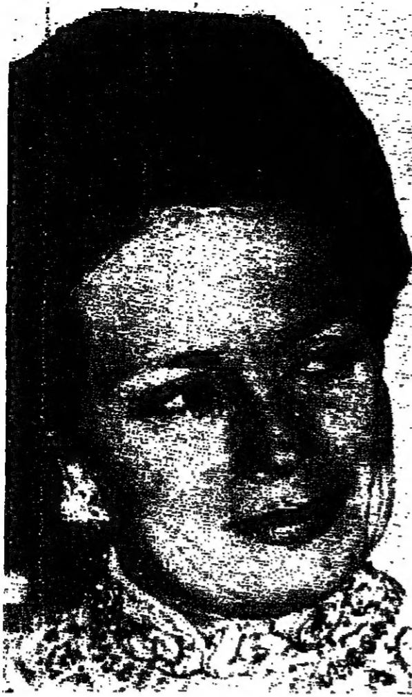
السيدة جيهان السادات في مكسيكو

قالت السيدة جيهان السادات في خطابها أمام المؤتمر العالمي للمرأة في مكسيكو، إن السلام شرط مسبق لتحقيق المساواة للمرأة.